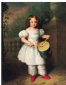
[11] Taller 7. Juegos de artista . Goya