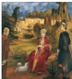
[7] Sábados en el Museo . Sala de Carreño